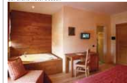
La suite Imperial del Grand Hotel Besson

Tra questi il Grand Hotel Besson, un gioiello incastonato tra le cime alpine, nel cuore della Val di Susa