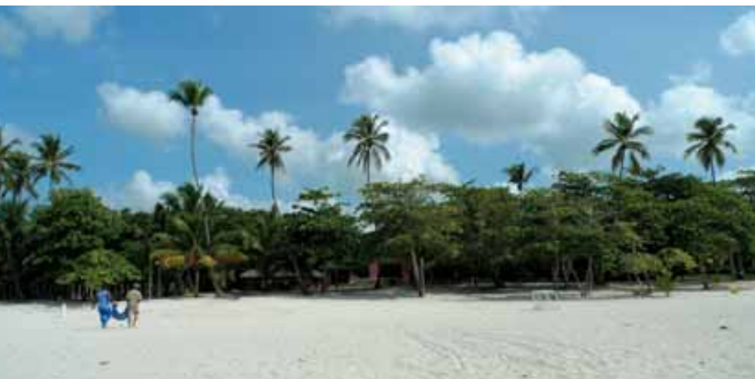
La spiaggia e, a destra, una camera del villaggio a Talaquera