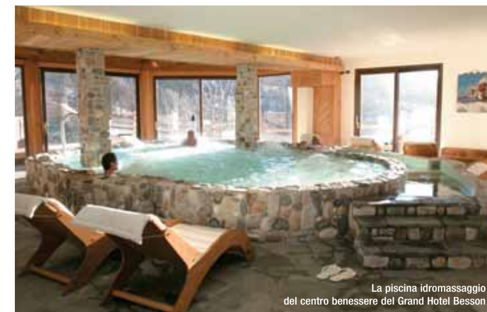
La piscina idromassaggio del centro benessere del Grand Hotel Besson